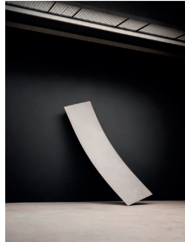
A Ductile® Piece

Con un espesor de 6mm, este nuevo material ofrece la belleza de las colecciones de Living con unas nuevas características que de seguro, facilitarán tanto los nuevos proyectos de revestimiento, como la amplia demanda en reformas.