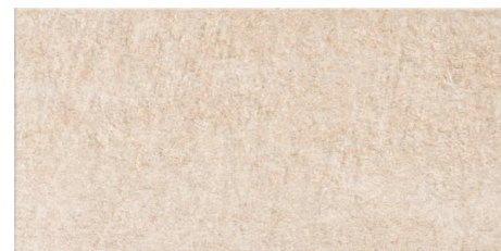
PIRINEOS BLANCO ANTISLIP 33 x 66,5 (G 90) 13" x 26,5" m 2