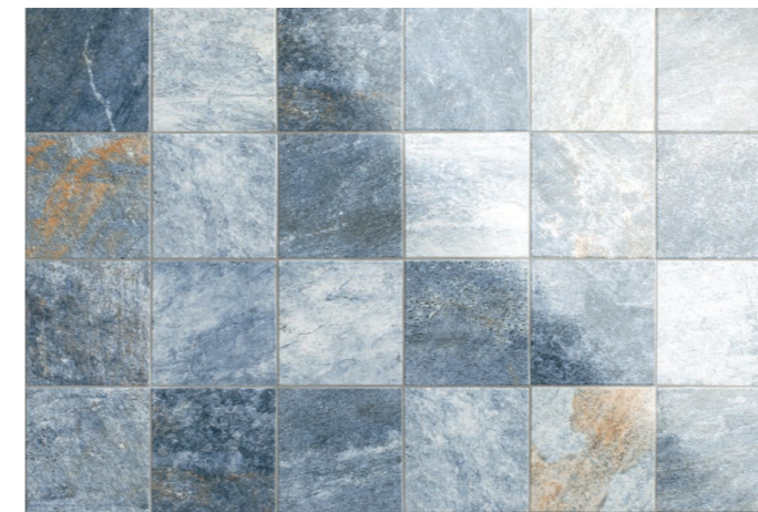
PIRINEOS MIX MARINO 15 x 15 (G 79) 6" x 6" m 2