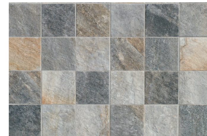
PIRINEOS MIX ANTISLIP 15 x 15 (G 79) 6" x 6" m 2