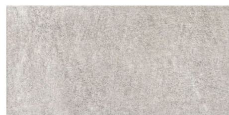
PIRINEOS GRIS ANTISLIP 33 x 66,5 (G 90) 13" x 26,5" m 2