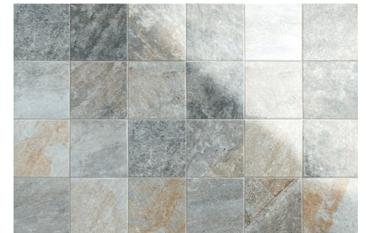
PIRINEOS MIX 15 x 15 (G 79) 6" x 6" m 2

PORCELÁNICO PORCELAIN TILE SUPERFICIE MATE MATT SURFACE