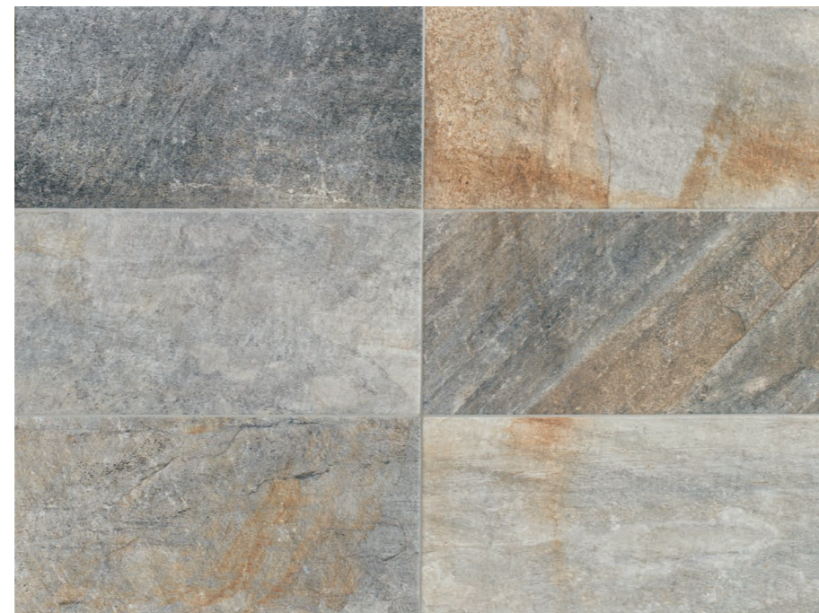
PIRINEOS MIX ANTISLIP 33 x 66,5 (G 90) 13" x 26,5" m 2

EVOLUTION EXTRUDED PORCELAIN TILE SUPERFICIE MATE MATT SURFACE