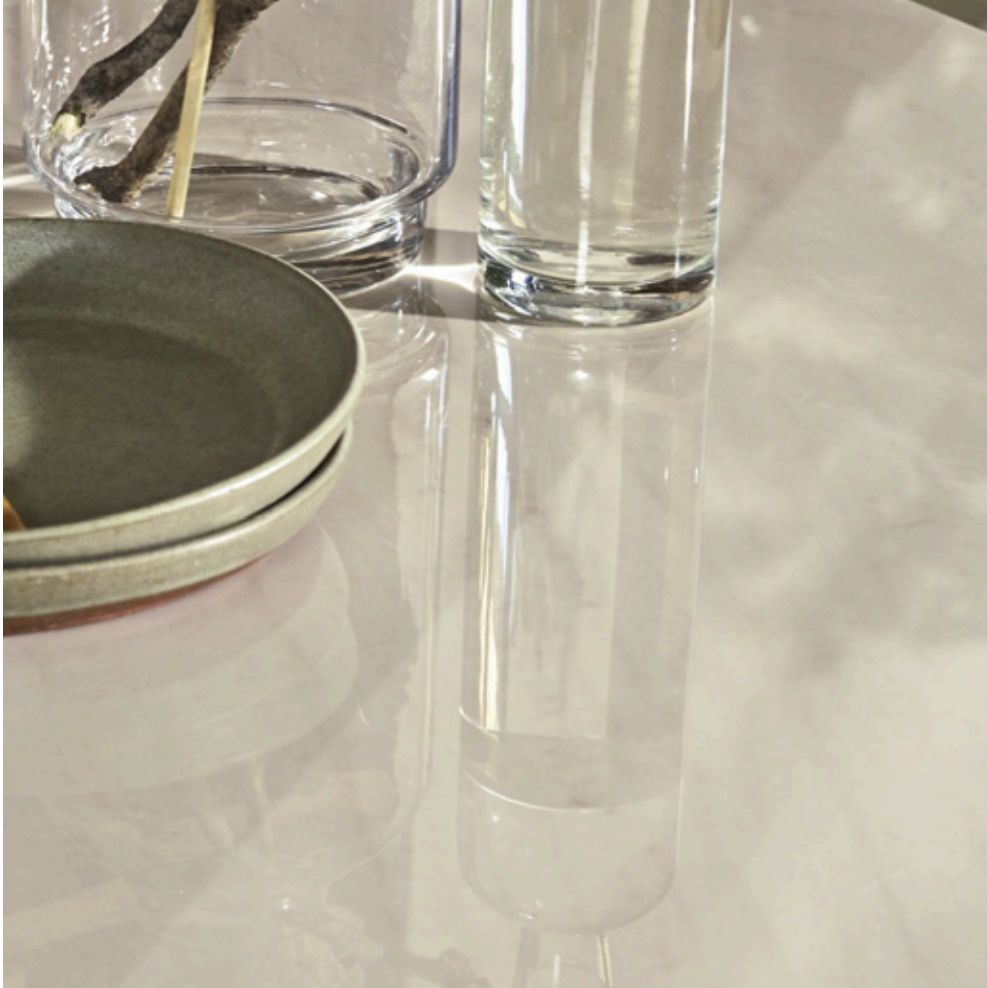
Mont Blanc Caramel