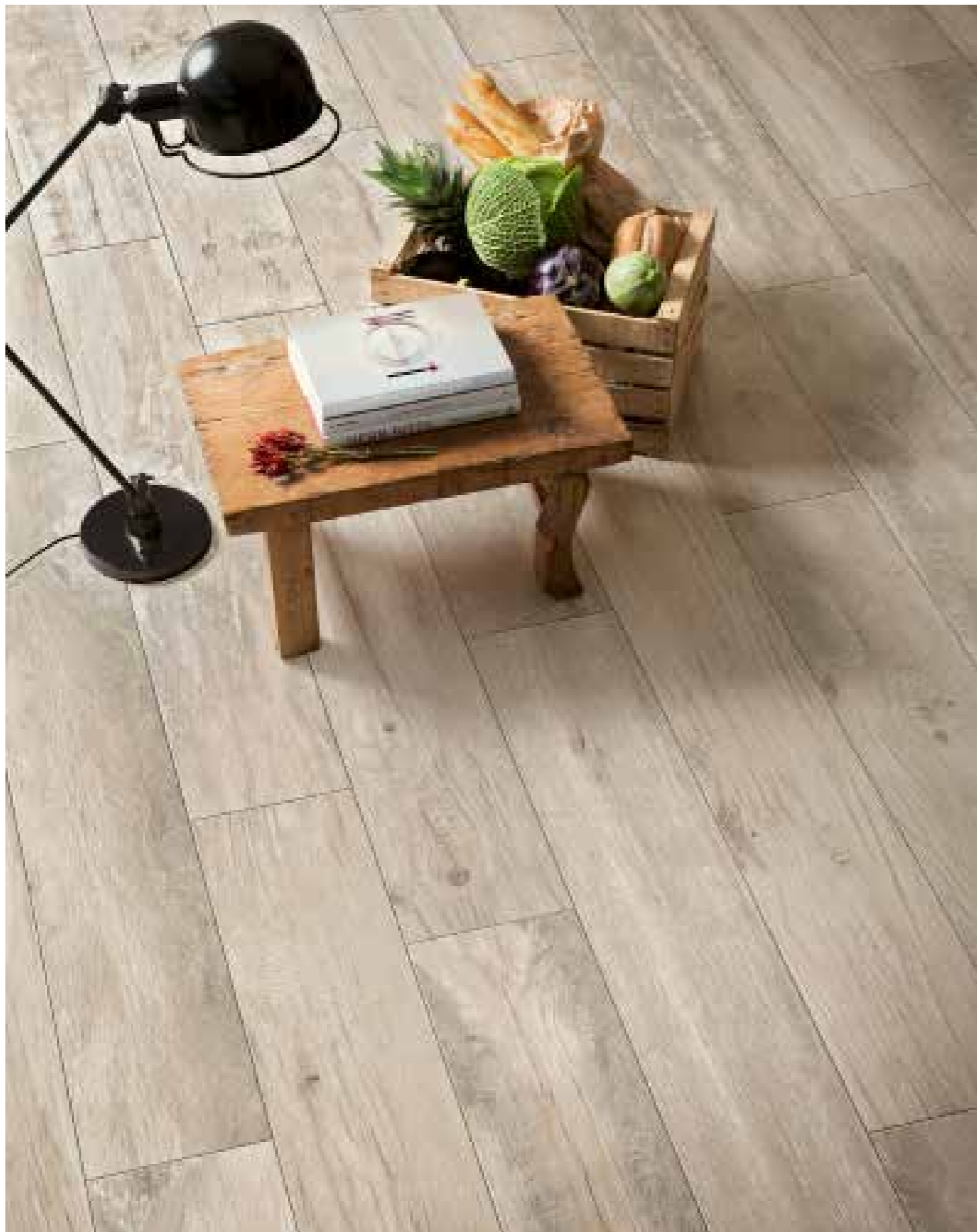
R55Z Ivory 20x120 - 77 7/8 " x 47 1/4 "