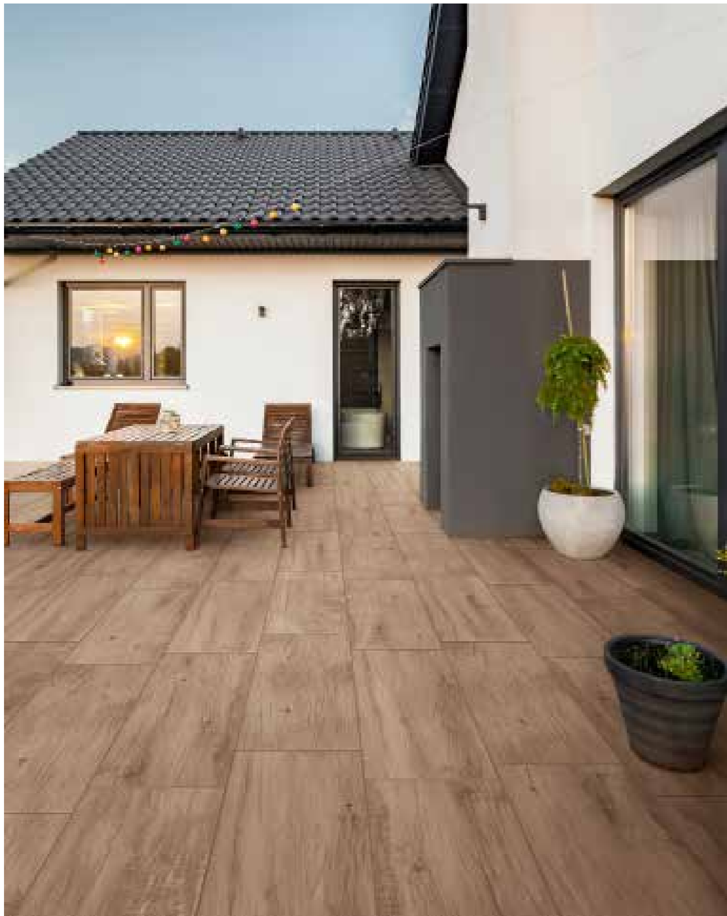
R5TR XT20 Honey Rettificato 40x120 - 15 3/16 " x 47 1/4 "