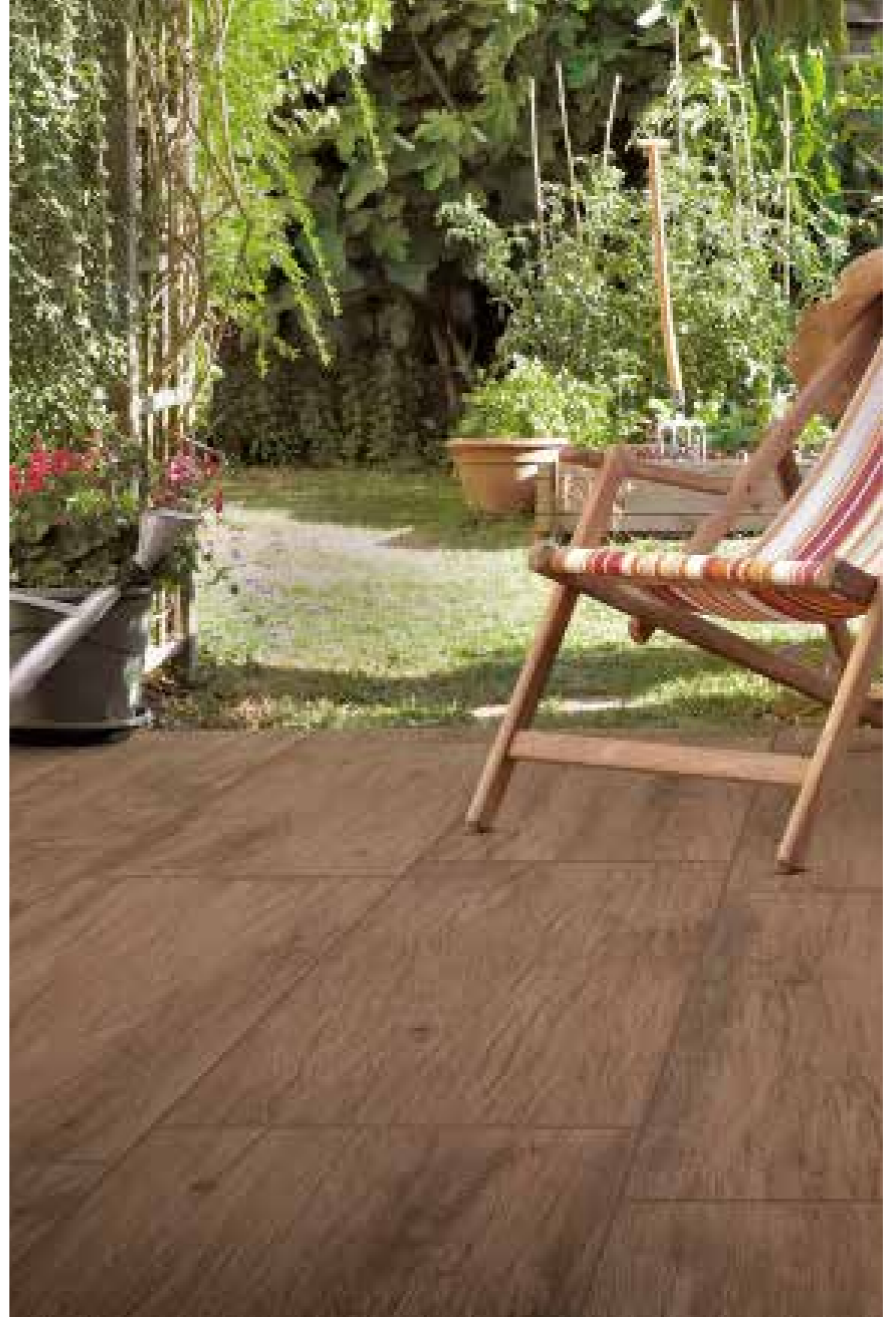
R5TS XT20 Caramel Rettificato 40x120 - 15 3/16 " x 47 1/4 "