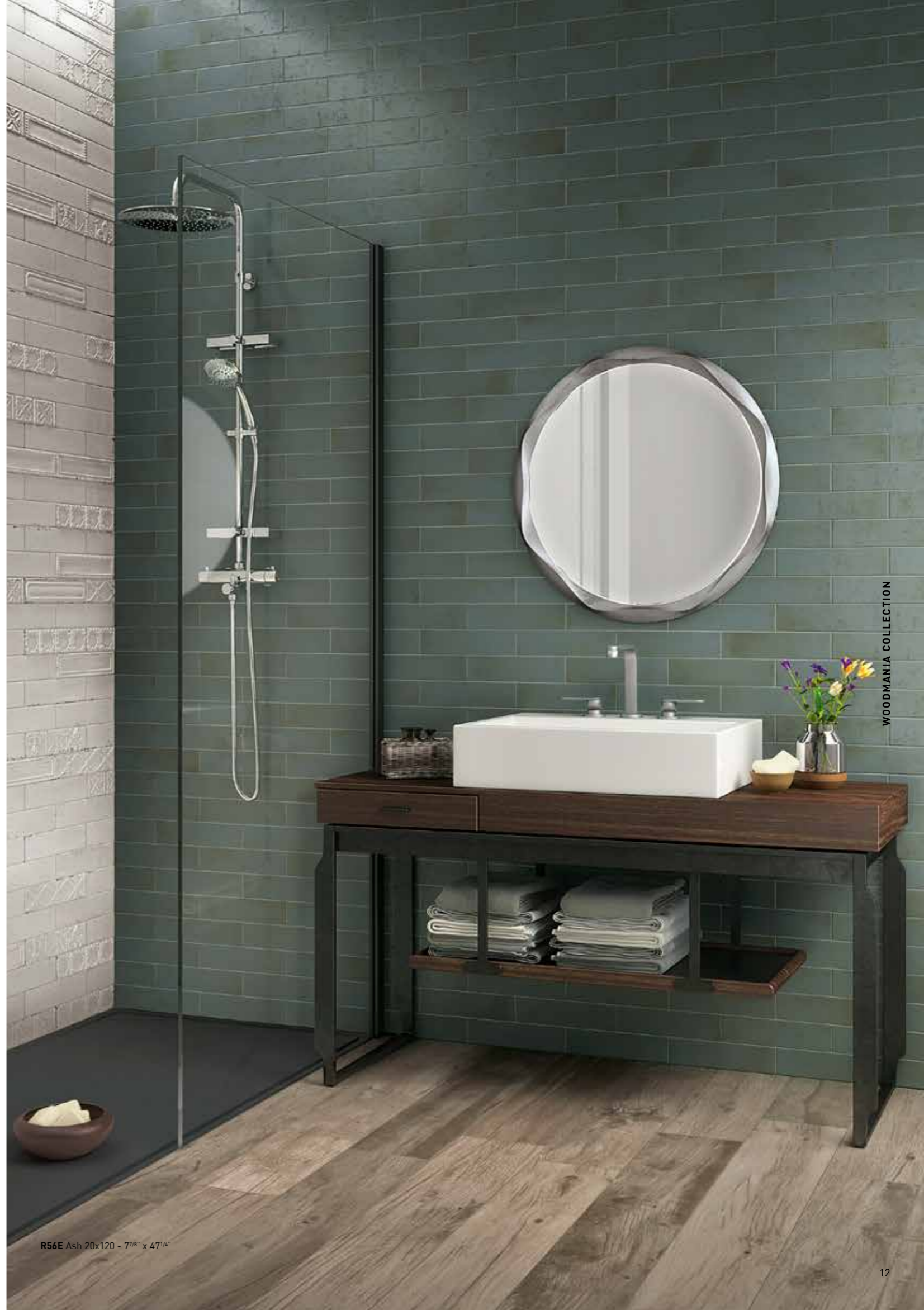
R56E Ash 20x120 - 7 10 / 8 " x 47 14 / 16 "