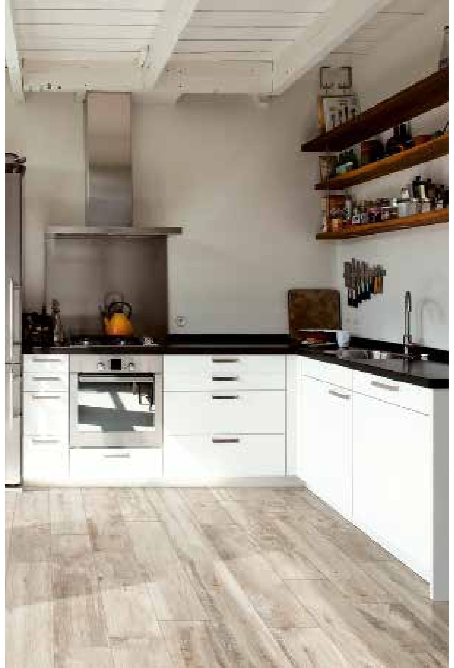
R55Z Ivory 20x120 - 77 7/8 " x 47 1/4 "