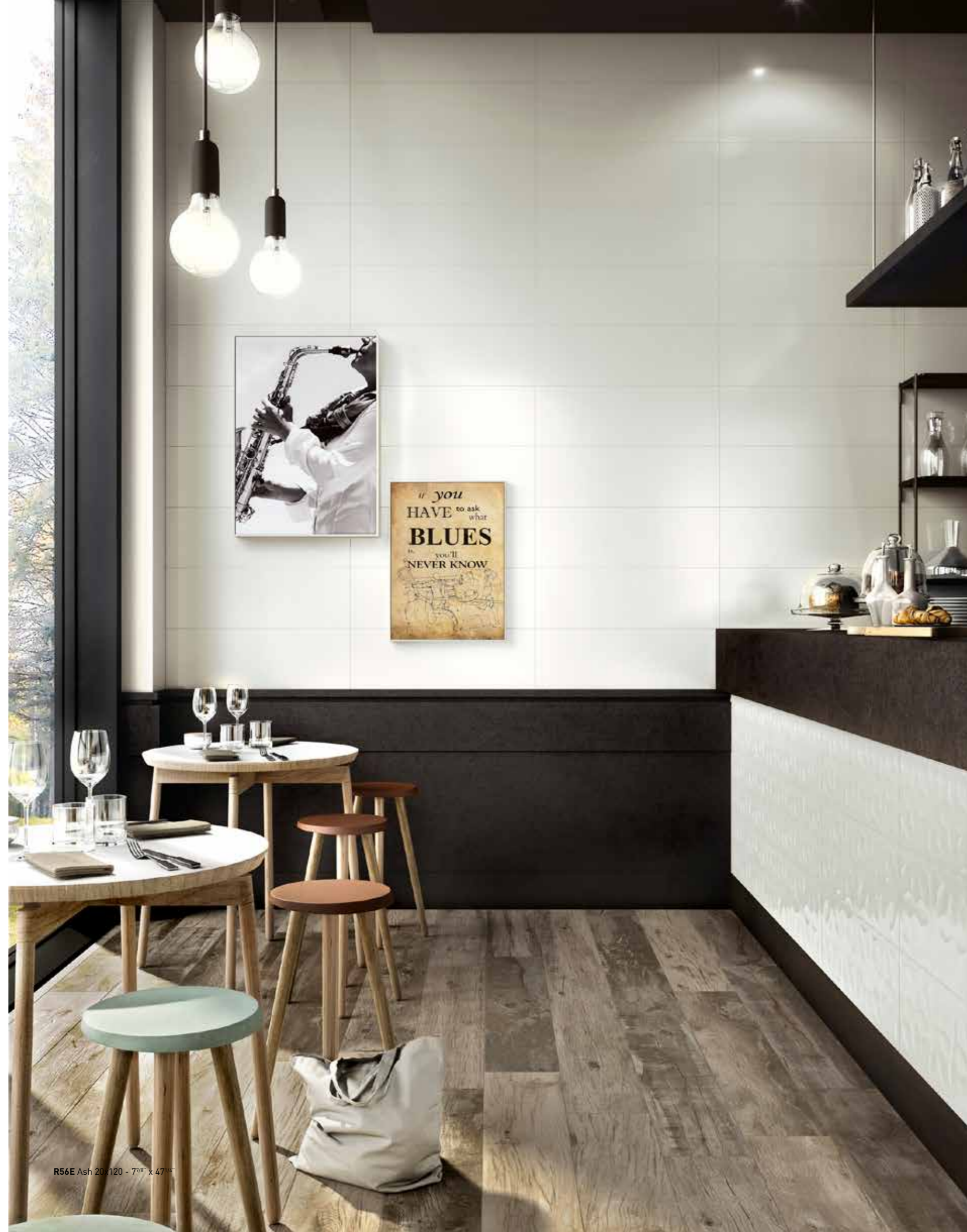
R56E Ash 20x120 - 7 1/8 " x 47 1/4 "