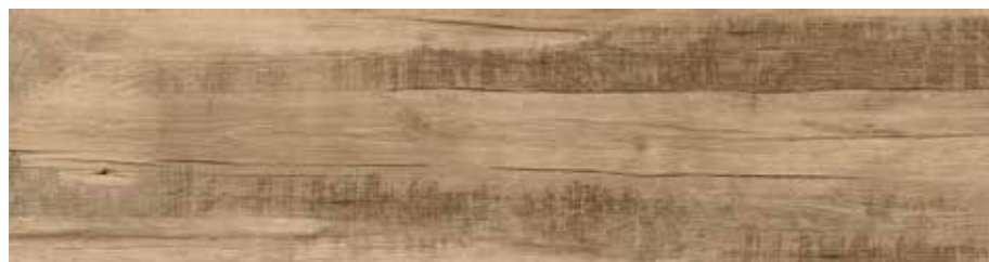
R56A 20x120 Honey R56M 20x120 Honey Grip