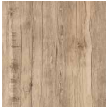
R5TR 40x120 Honey Rett