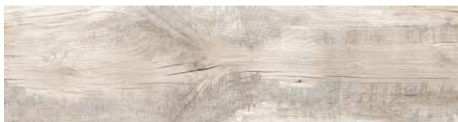
R55Z 20x120 Ivory R56L 20x120 Ivory Grip