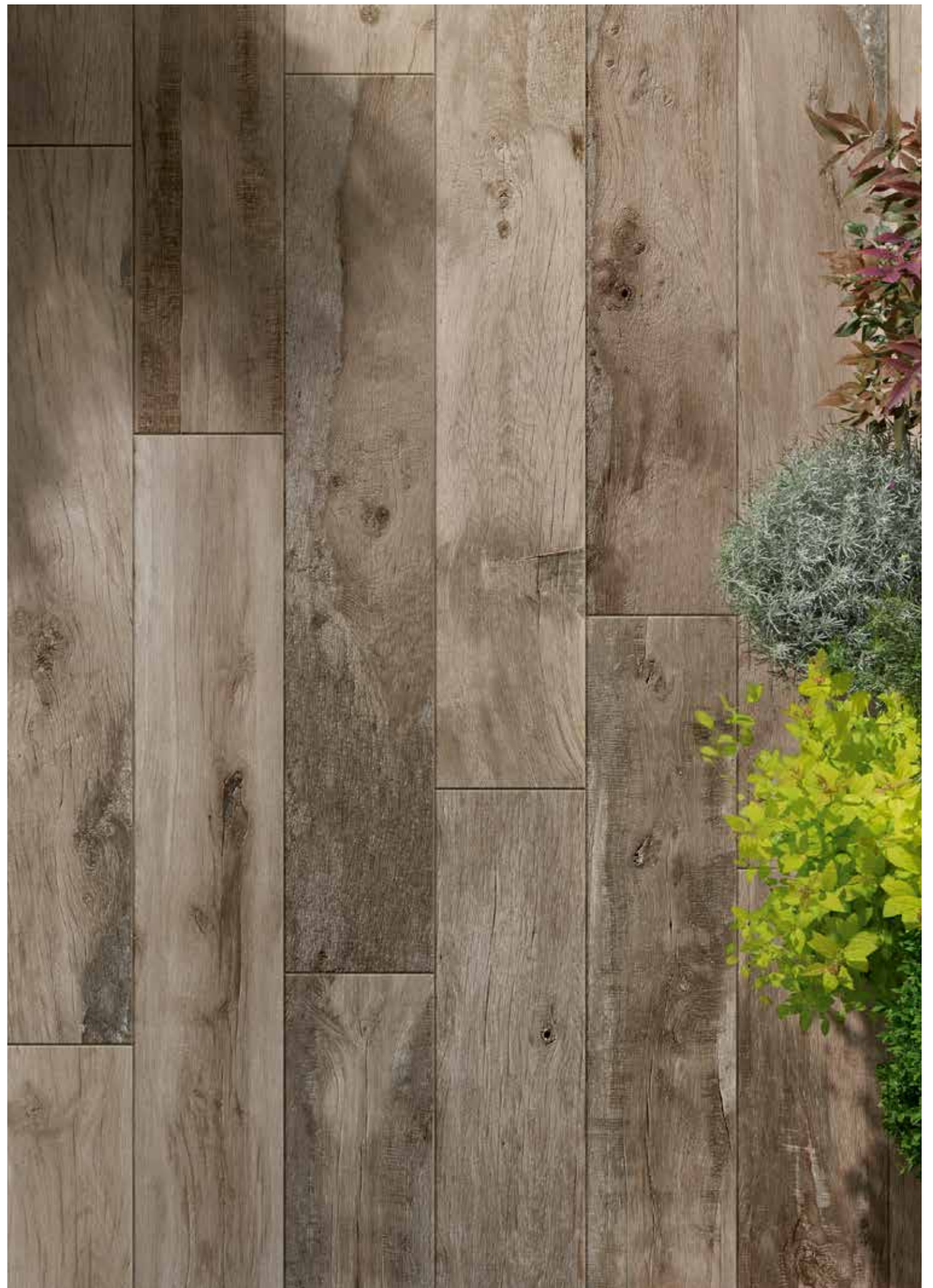
R56Q Woodmania 20x120 - 7 7/8 " x 47 1/4 "