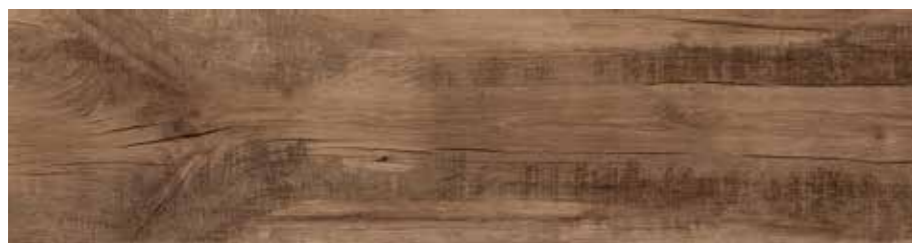
R56C 20x120 Caramel R56N 20x120 Caramel Grip