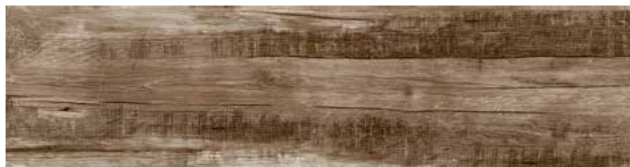
R56D 20x120 Musk R56P 20x120 Musk Grip