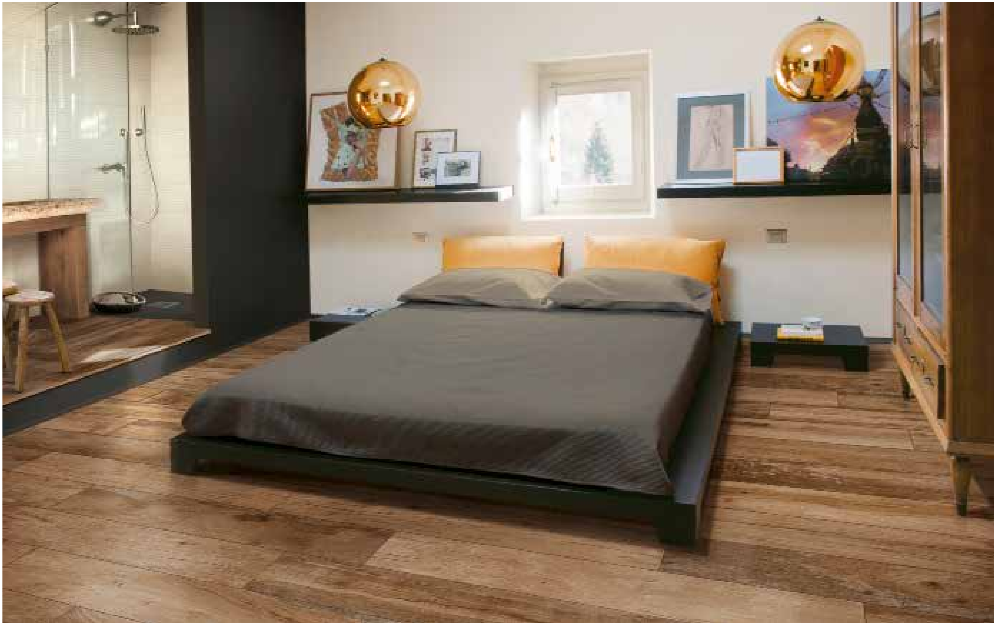
R56C Caramel 20x120 - 77 80 x 47 14