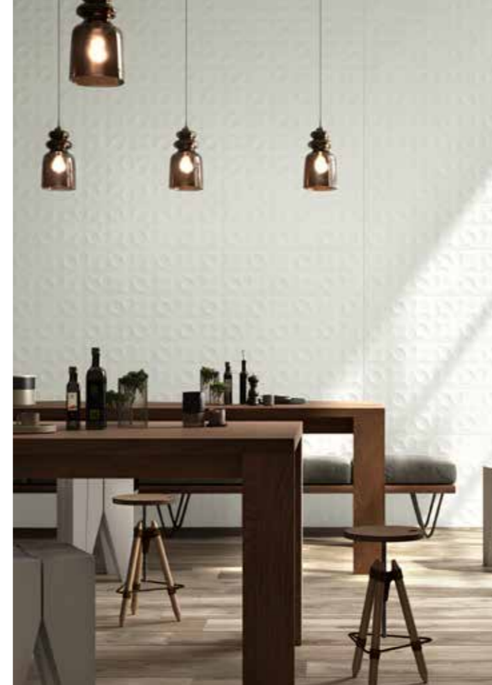
XXXX Dida prodotto