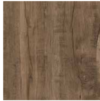
R5TS 40x120 Caramel Rett