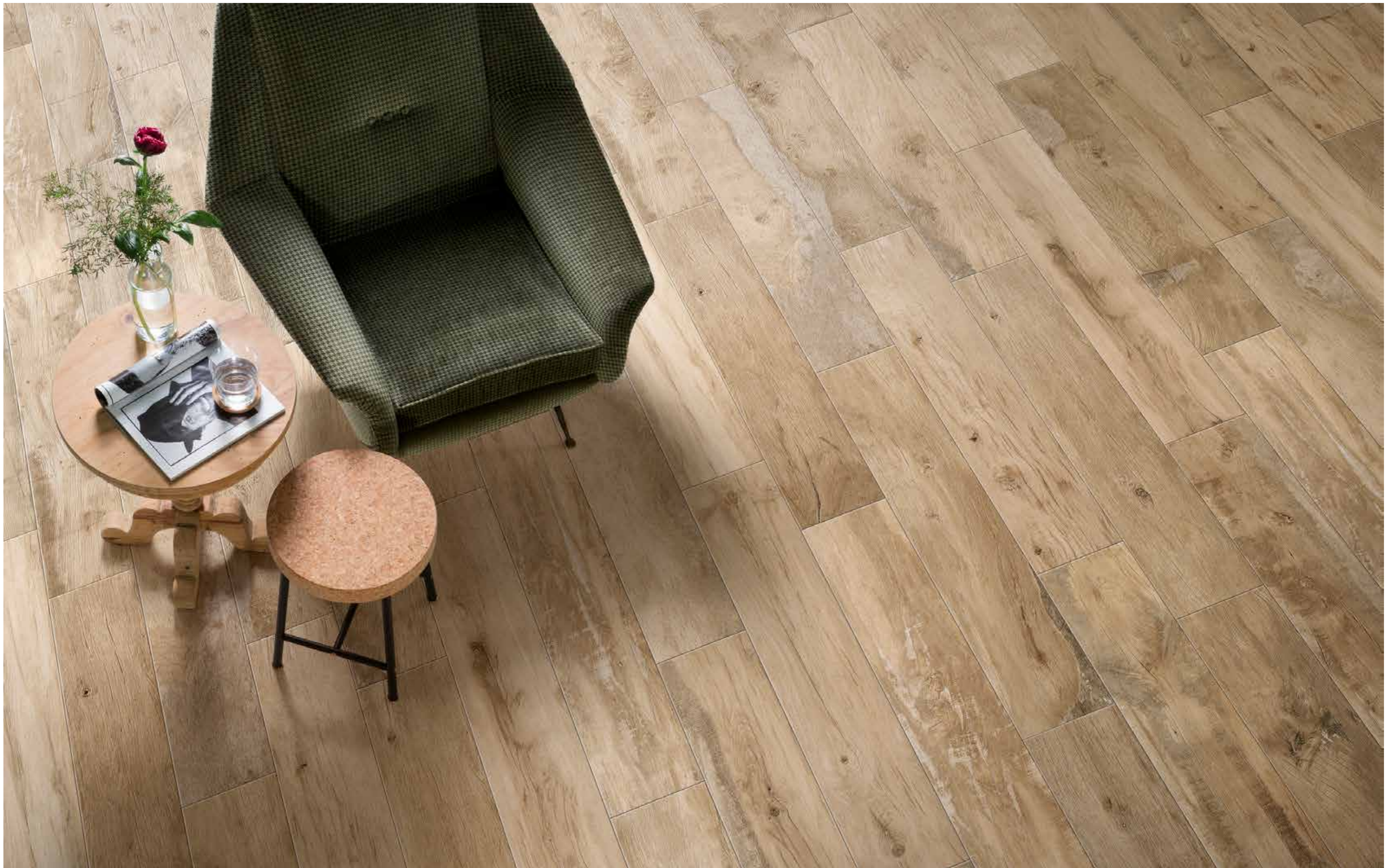
R56A Honey 20x120 - 7 7/8 " x 47 1/4 "