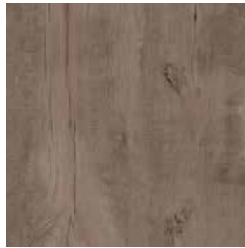
R5TT 40x120 Musk Rett