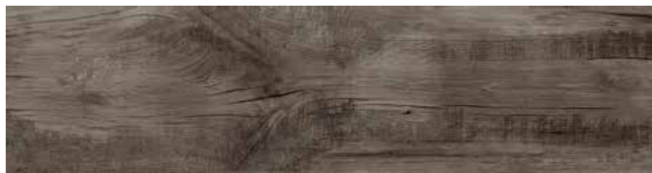
R56E 20x120 Ash R56Q 20x120 Ash Grip