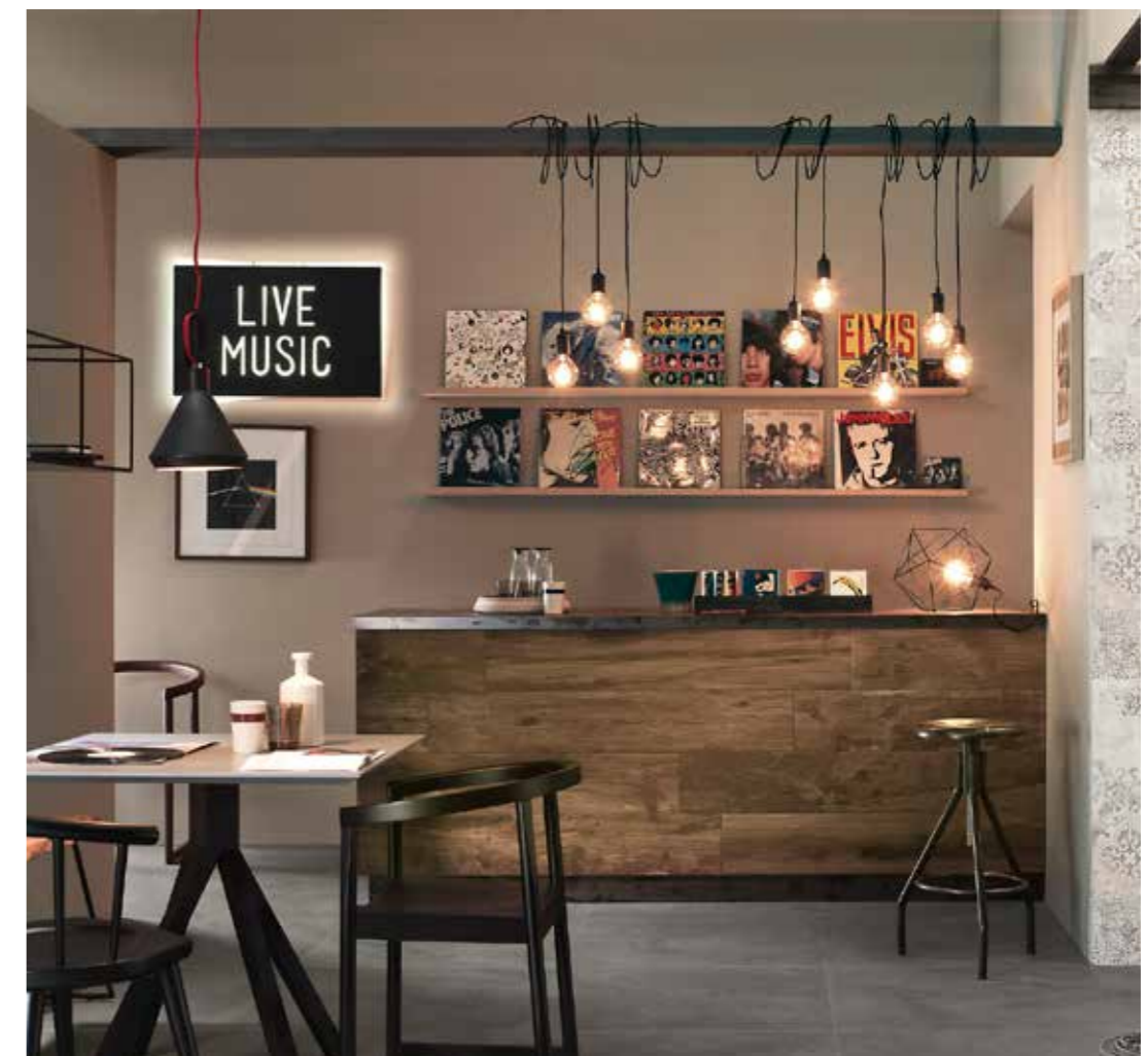
R56D Woodmania Ash 20x120 - 7 1/8 " x 47 1/4 " - R53M Boom Pimbo 60x60 - 23 5/8 " x 23 5/8 "

ideal for strongly characterised commercial projects / ideal auch für große und markante Geschäftsräume / idéal aussi pour les espaces commerciaux de grande caractère / ideal también para espacios comerciales de gran carácter / идеально также для больших торговых помещений с характером